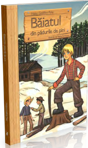
Băiatul din pădurile de pini 176 pagini